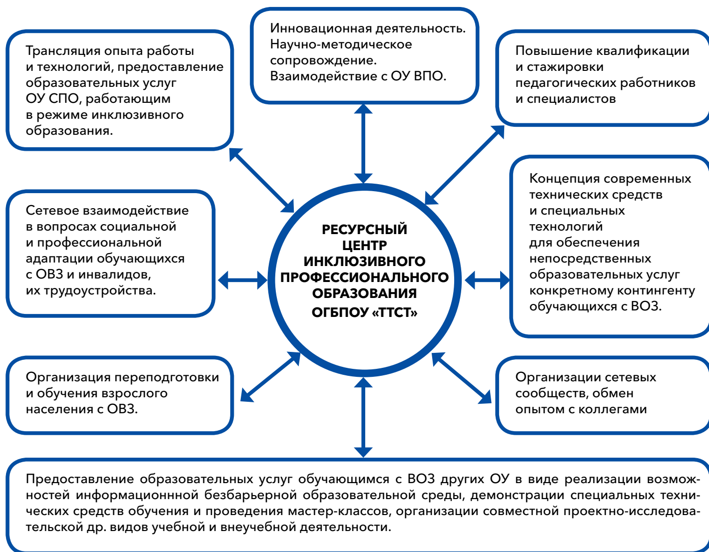
РИСУНОК 1. Функции РЦ

Приоритетным направлением деятельности стажировочной площадки стало развитие кадрового потенциала инклюзивного профессионального образования Томской области.